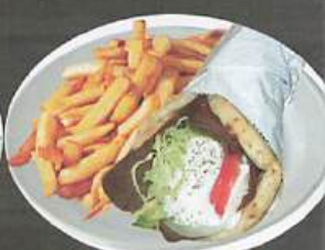
ASS. PITA AU POULET OU GYROS OU PORC avec frites 19 Pita seul: 8