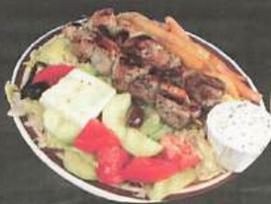
ASS. DE SOUVLAKI PORC 1 bâton 17