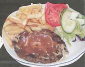
HAMBURGER STEAK 18