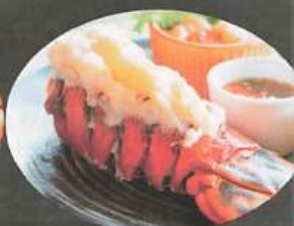
LANGOUSTINE (10) 31