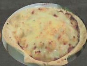
ASSIETTE COQUILLE ST-JACQUE 28