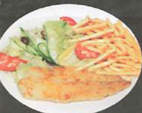
FILET DE SOLE 19