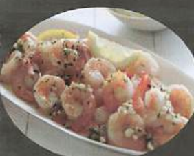
CREVETTES BANG-BANG 28 (15mcx)