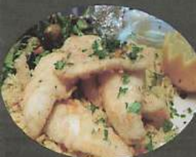
FILET PERCHAUDE 31