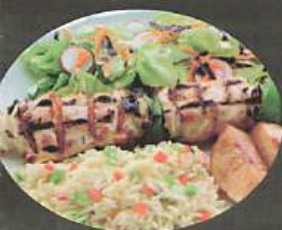
ASS. BROCHETTE POULET 1 bâton 19

Toutes les assiettes sont servies avec patates grecque, riz et salade