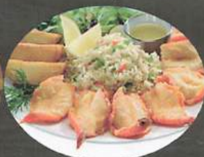
CREVETTE PAPILLON (8) 31