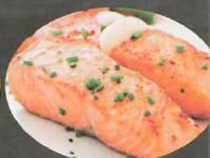
FILET SAUMON 28